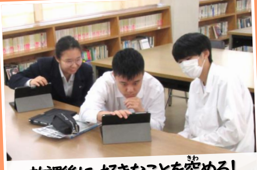
放課後に、好きなことを究める!

放課後の主体的な活動 ◆ 放課後の時間を活用し、生徒一人ひとりの興味・関心に応じた主体的な活動等を支援します。 ※ 主体的な活動とは、スポーツ・文化・探究活動など、生徒が主体的に参加する活動です。詳細は、今後学校が検討します。 ※ 各附属中学校には、学校部活動は設置しません。