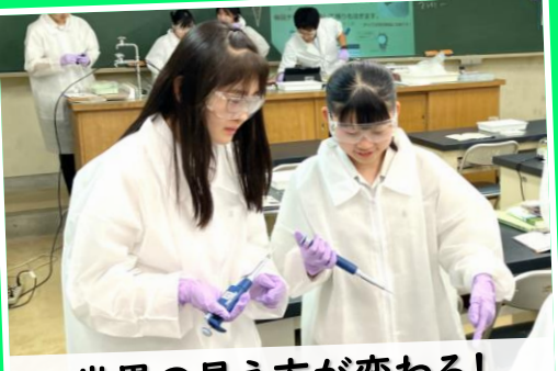
世界の見え方が変わる!

多様な関係機関等と連携した探究的な学習 ◆ 高校の文理探究科と連携した探究的な学習や、大学・企業・行政機関等と連携した先進的な学習を実施し、未来を切り拓く力を育成します。