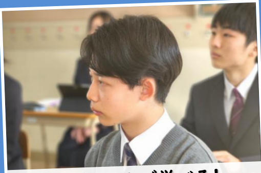
高いレベルで学べる!

先取り学習、発展的な学習 ◆ 国語・数学・英語等で標準時間数以上の授業を実施し、高校の内容の先取りやその内容に触れる発展的な学習を実施することで、難関大学への進学に必要な学力を育成します。