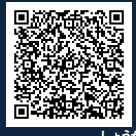
▲ 文理探究科紹介動画はこちら ▲ 文理探究科紹介リーフレットはこちら