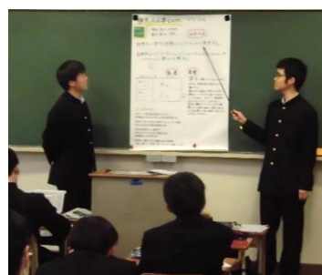
「教室の機気とインフルエンザの関係」について研究したグループ