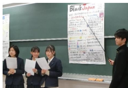
発表練習会の様子

事後のアンケート調査には、「同じテーマであっても、アプローチの仕方によって結果が違ってくるのがよく分かった」など、課題研究による学びを理解した感想が多く見られました。