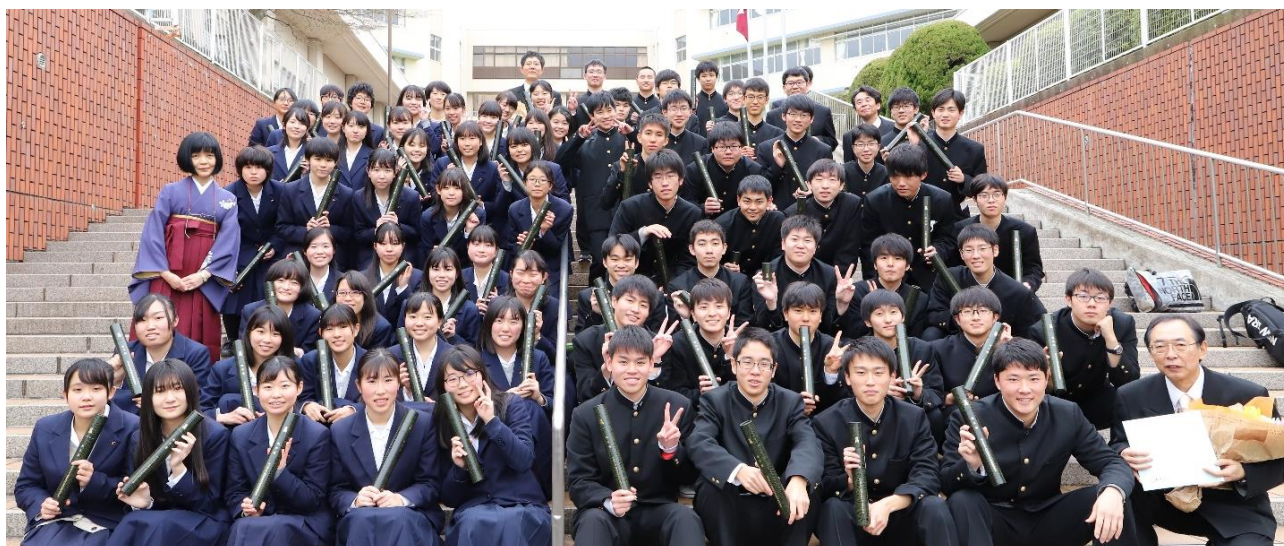
卒業した探究科の1期生