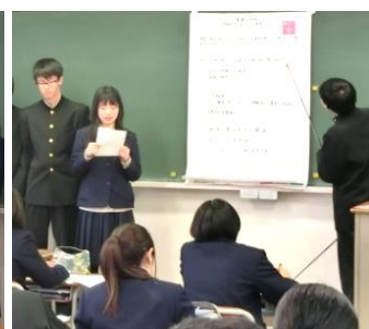
「子どもの貧困」について報告したグループ