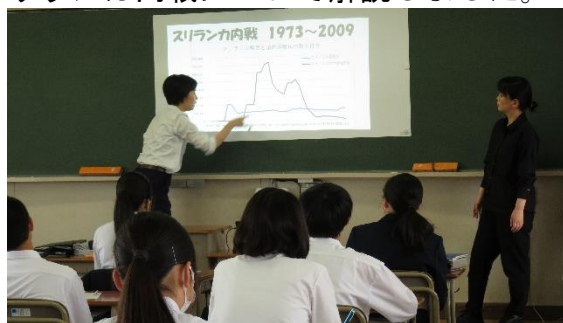
内戦で起こった出来事と、難民の人数の変化を比較する

シンハラ人とタミル人が居住していました。独立後は、シンハラ人を優遇する政策がとられたため、 武力によってスリランカからの独立を目指す勢力が生まれました 。こうした背景で始まった内戦であることから、スリランカ政府もMSFの活動に制限を加えるなど、貫戸さんが厳しい環境で活動されていたことを理解することができました。