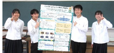
奨励賞を受賞した公民班の生徒