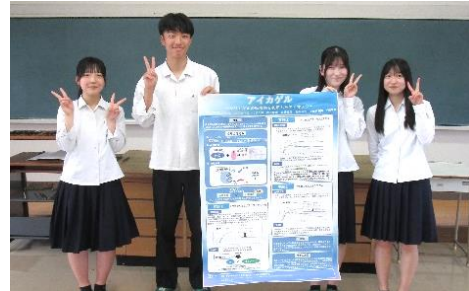
2次審査進出が決めた化学1班の生徒