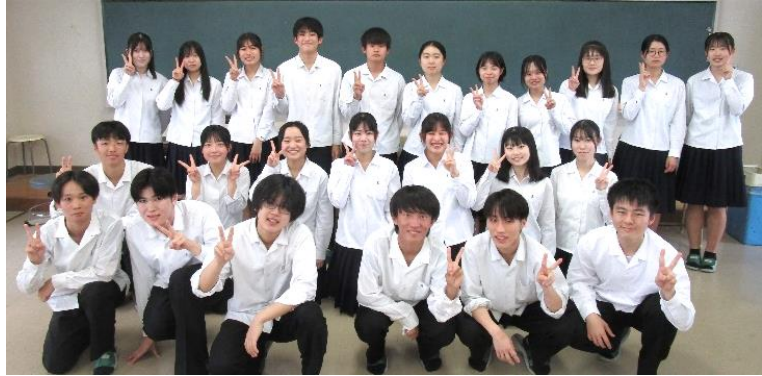
2024年度(第19回)高校環境化学賞に応募した探究科の生徒