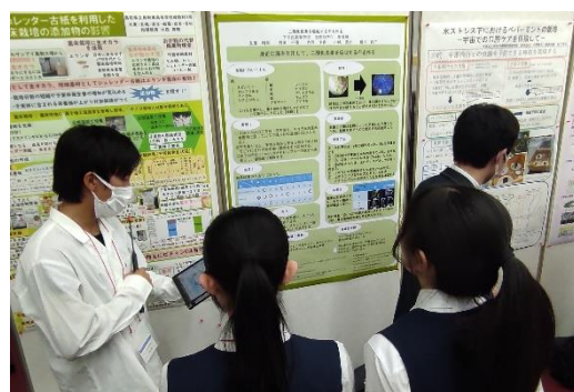
他校の生徒に発表する、家庭班の生徒

家庭班は、日常生活で使用する 衣服に二酸化炭素を吸収する機能 をもたせ、地球温暖化などの 環境問題を解決 することを目指して研究してきました。研究では、衣服に用いる 布に藻類を生息させ、光合成による二酸化炭素の除去 を目指しました。藻類は、乾燥に弱いため、水を供給し続けることが大切で、 寒天培地 を使用して乾燥を防ぐ方法を紹介することができました。参加した高校生ポスター発表は、大学院生などのポスターセッションと同じ会場で開催されており、学会の先生方に加え大学の3、4年生や大学院生から、様々なアドバイスをいただくことができました。