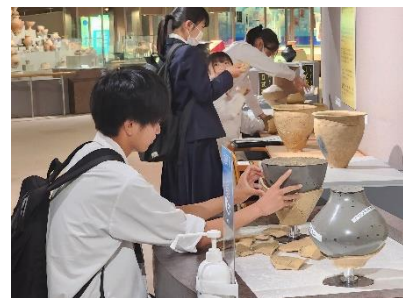
土器の復元に挑戦する生徒